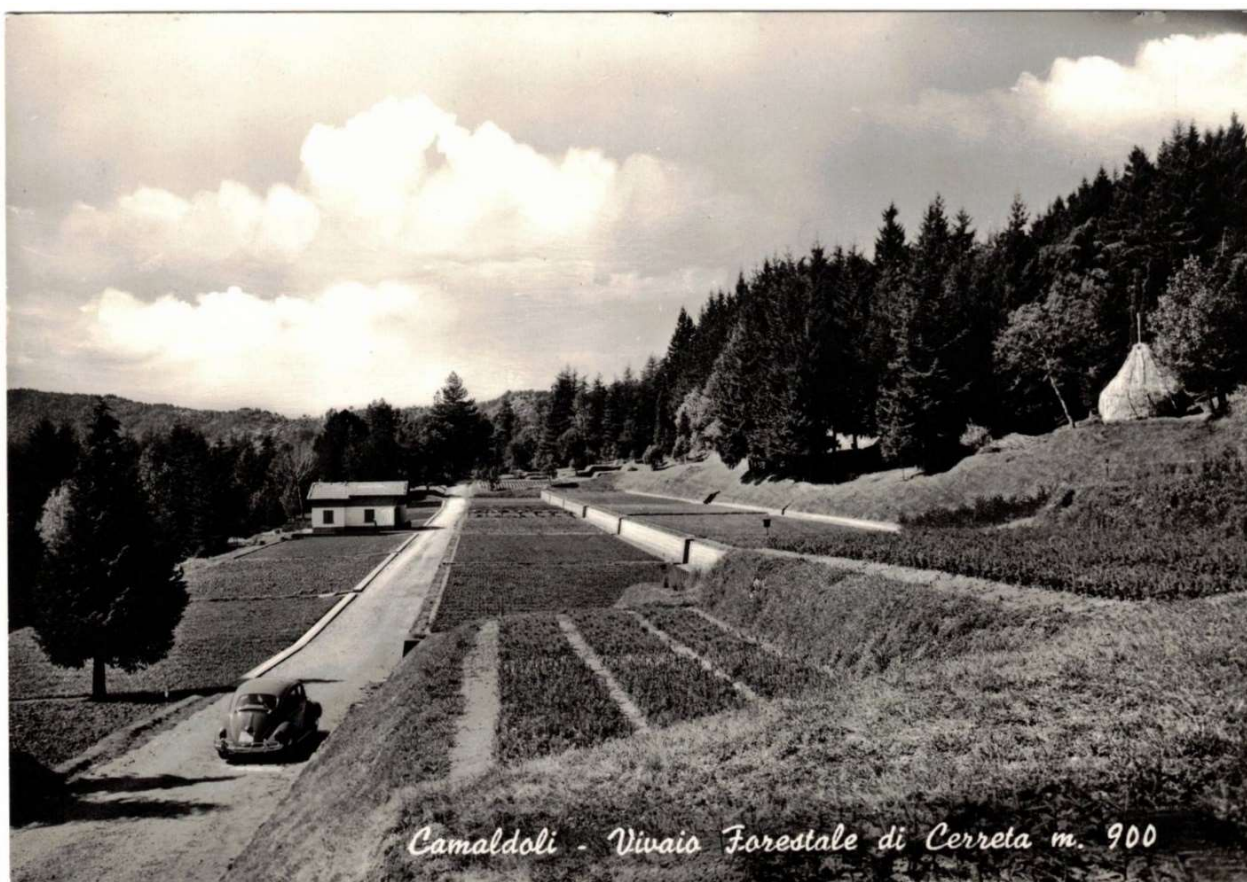
Cartolina raffigurante il vivaio forestale di Cerreta (Camaldoli) dell'archivio storico dei monaci di Camaldoli